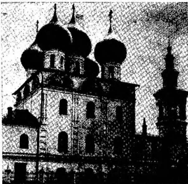
Церковь Николая „во Владычней слободе“