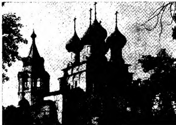
Церковь Варлаама Хутынского