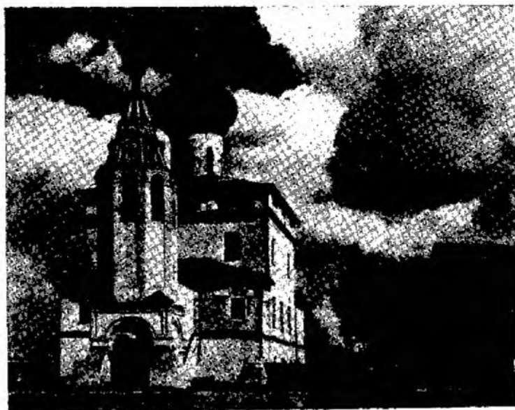
Церковь Константина и Елены

Не менее величав и торжественен интерьер Софийского собора. Здесь не осталось и следа от северной суровости его внешнего