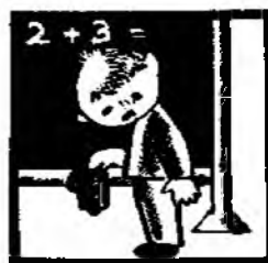
Он ... задачу.