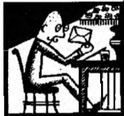
Он написал письмо.