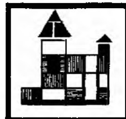
Они ... дом.