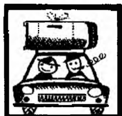
они купили холодильник.