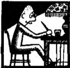
Он писал письмо.