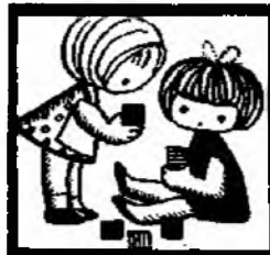
Они ... дом.

7. Fill in the blanks with the verbs: строили, построили, рисовал, нарисовал, решил, решил.