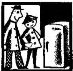
Они покупали холодильник.