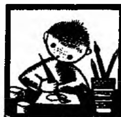
Он ... папу.