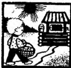
Он пошёл к ...