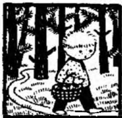
Он вышел из ...

Т.: 537. Д.: В 17 часов. Т.: Спасибо. Д.: Пожалуйста.