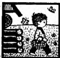
Он отошёл от ...