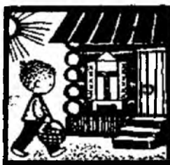
Он подошёл к ...