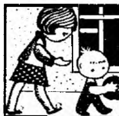
Мой сын уже ходит.