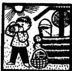
Он подошёл к ...