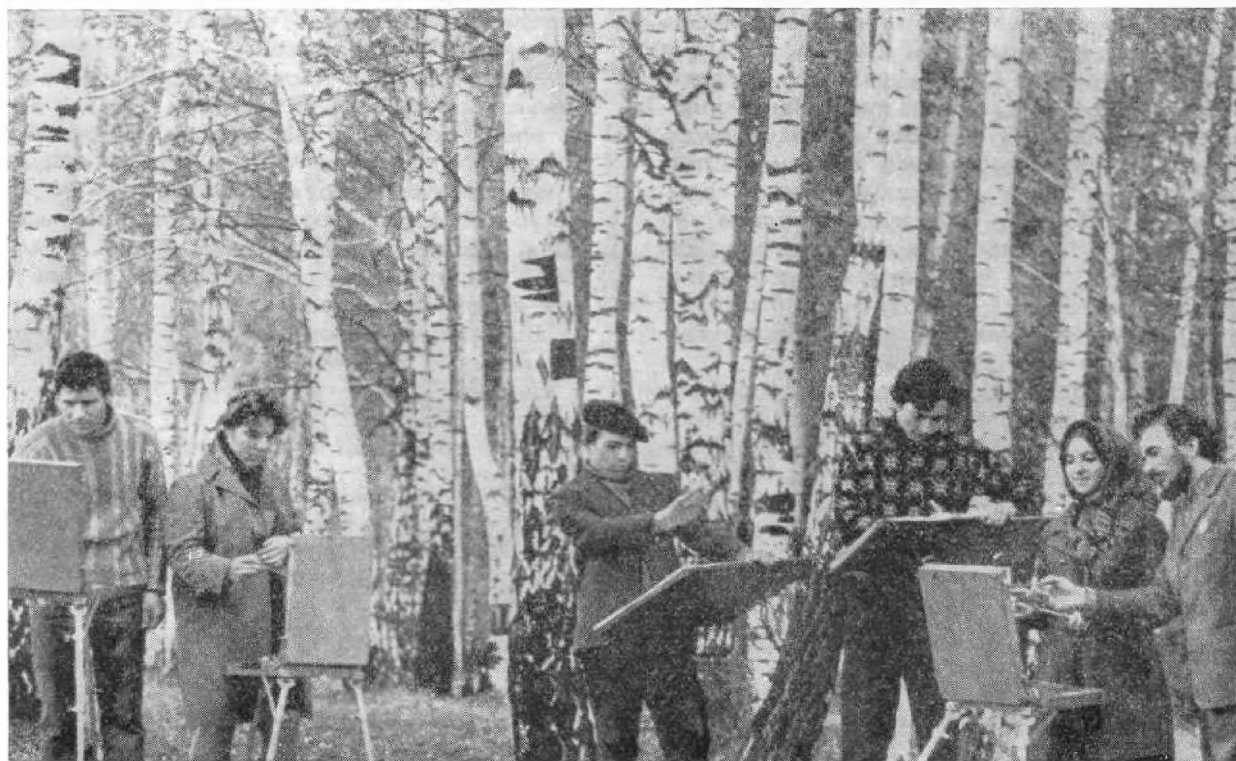
Учащиеся Федоскинской художественной школы на этюдах.

традиции промысла. Многие из них — выпускники профессионально-технической школы (она организована в Федоскино в 1931 году), сыгравшей значительную роль в развитии искусства лаковой миниатюры. Благодаря совместным творческим поискам и тесному контакту между мастерами старшего поколения и молодёжью в Федоскино создаются уникальные произведения, которые с неизменным успехом демонстрируются на крупных международных выставках, а также входят в экспозиции лучших произведений советского искусства в СССР и за рубежом. Старейшие художники передают молодым свой богатый опыт и высокое мастерство, помогают в освоении сложных технических приёмов письма.