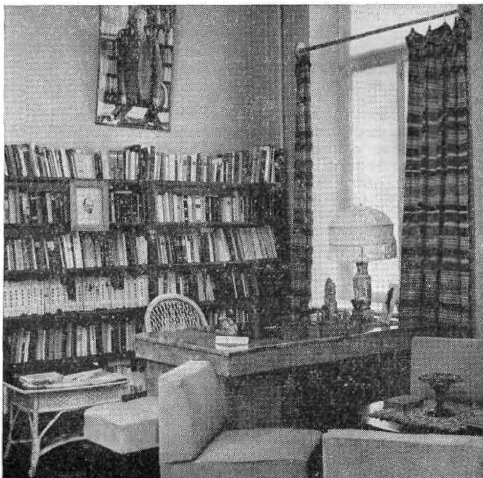
Рабочий кабинет А. А. Фадеева в Переделкине под Москвой.

Наряду с напряжённой писательской работой Фадеев в 30-е годы принимает деятельное участие