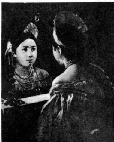
Иллюстрация художника К. Брюлова к поэме В. А. Жуковского «Светлана».

Любовь, которая вдохновляет его на подвиг, свершения и стремление «к прекрасной, возвышенной цели», утверждал поэт. Чувство любви — высокое чувство, оно украшает человека. Другое необходимое условие счастья — стремление «к возвышенной цели» — это именно то, что делает человека человеком, одухотворяет его, наполняет смыслом его жизнь.